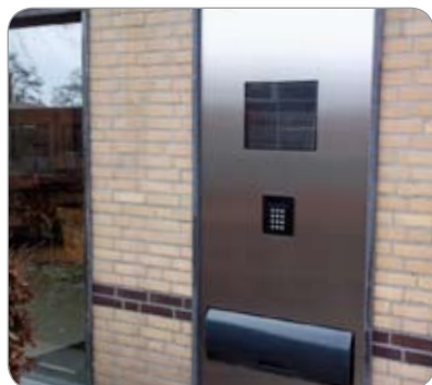
De vernieuwde RoboWall.